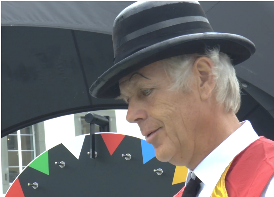
Video für YouTube